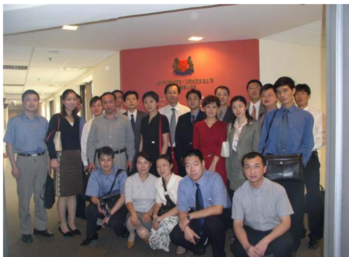
拜访新加坡总检察署，与新加坡检察官员合影留念。

及商业事务局长贪污的案件，有判处美国人涂鸭鞭刑的案件，也有判处菲律宾女佣谋杀而处绞刑的案件。尽管上述这些被定罪处刑的人有的曾是建国功臣，有的有外国总统代为求情，法院也是依法公事公办。